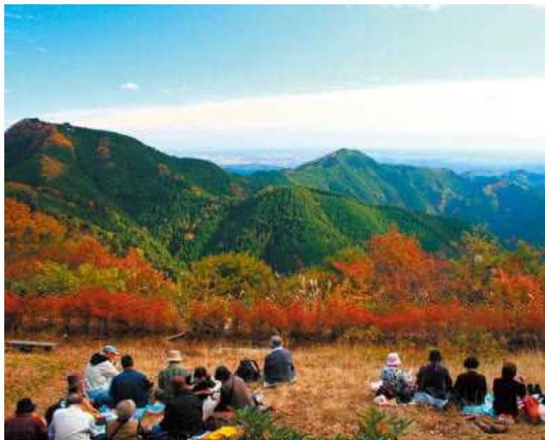
長尾平 神社から5分の見晴らしの良い場所。